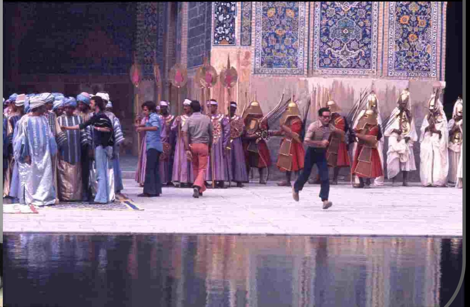
Lima - Perú - Istituto Italiano di Cultura