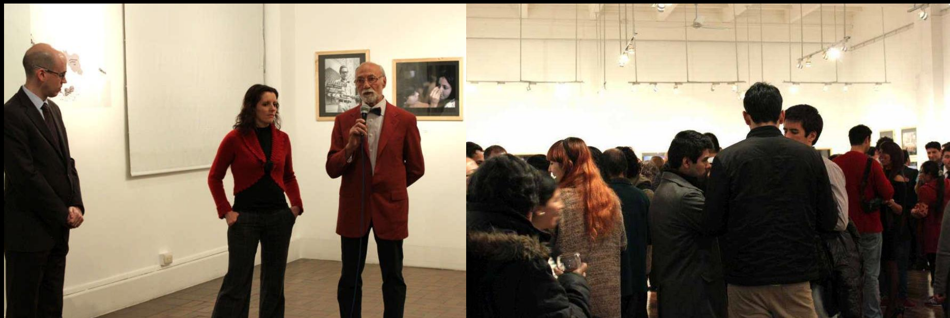
Lima - Perù - Istituto Italiano di Cultura - Vernissage - El Oriente de Pasolini en las fotos de Roberto Villa