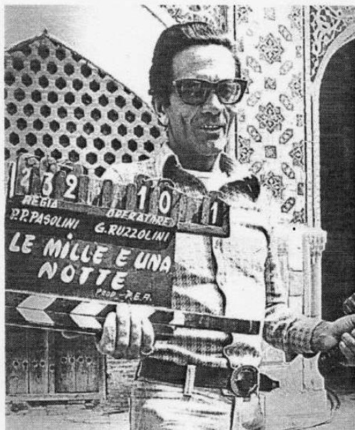
Referente. Pier Paolo Pasolini fue uno de los más notables escritores y cineastas italianos del siglo XX.

"Hacer fotografía en la actualidad es muy fácil porque hay muchos medios tecnológicos", comenta Villa. En términos absolutos, la tarea es más sencilla que antes; sin embargo, el balance es negativo. "Todo el mundo se cree un fotógrafo en potencia, pero la fotografía