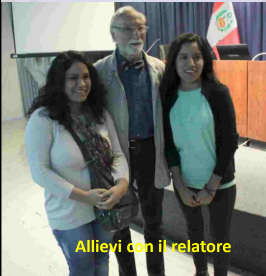
Allievi con il relatore