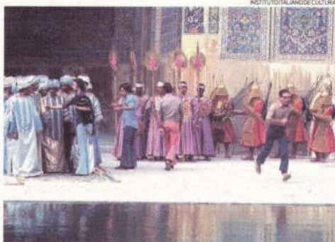
Testimonio. La muestra registra lo que ocurre dentro y fuera del set.