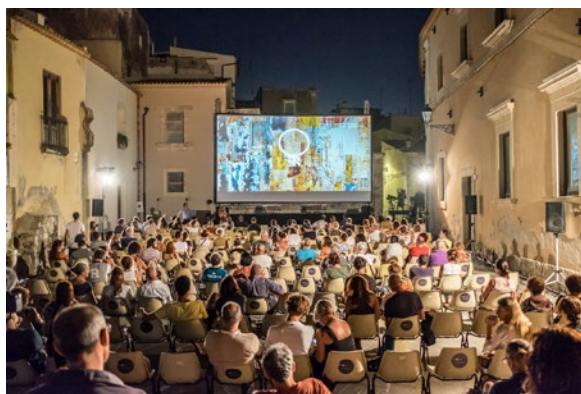
Ortigia Film Festival

nomiche che dovranno sostenere la promozione cinematografica nel prossimo quinquennio, magari attraverso progetti mirati che possano attingere al PNRR. Adesso che la pandemia ci sta dando una tregua e pare volga al termine,