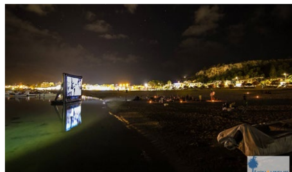
SiciliAmbiente Film festival