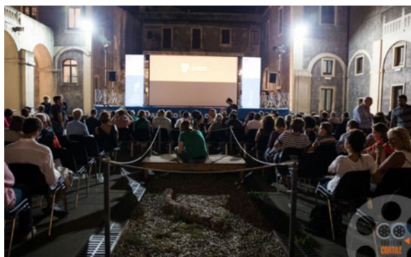
Corti in Cortile