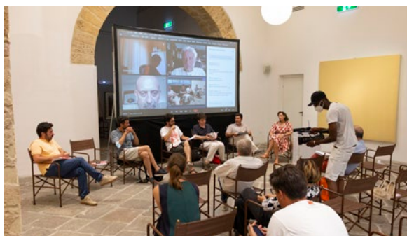
Un'Assemblea dei Soci di FCS