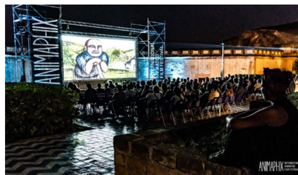
Animaphix Film Festival