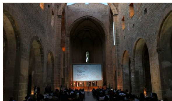
Sole Luna Doc Film Festival