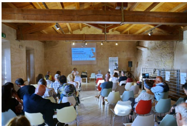
Un'incontro al Sardinia Archeo Festival 2022

guerre, si sono favoleggiati mondi sconosciuti e fuggiti regni in rovina, si sono affrontate tempeste e combattuti mostri inimmaginabili, si sono imparate lingue, migliorate invenzioni, scambiati saperi, sperimentati cibi, sapori e profumi, ascoltati suoni, musiche e canti. Tutto questo fermento, questo costante