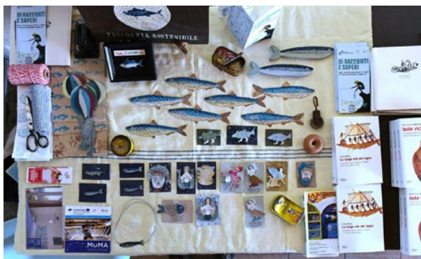
Creazioni Tzilipicche di Mare