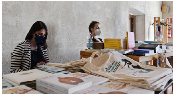
Merchandising Sardinia Archeo Festival 2022 - (foto di Dietrich Steinmez)

Nella seconda edizione (nel 2020), tutta in formato online a causa della terribile situazione di crisi pandemica, intitolata "Odissee", si è analizzato a fondo il dinamismo dell'essere umano in continuo movimento sul nostro mare, su quel Mediterraneo in cui, per secoli, si sono intrecciate rotte, incontrati e scontrati popoli, si sono suggellate amicizie e giurate